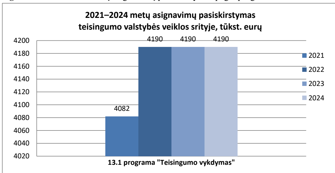
1 grafikas. 2021–2024 metų asignavimų pasiskirstymas pagal programas